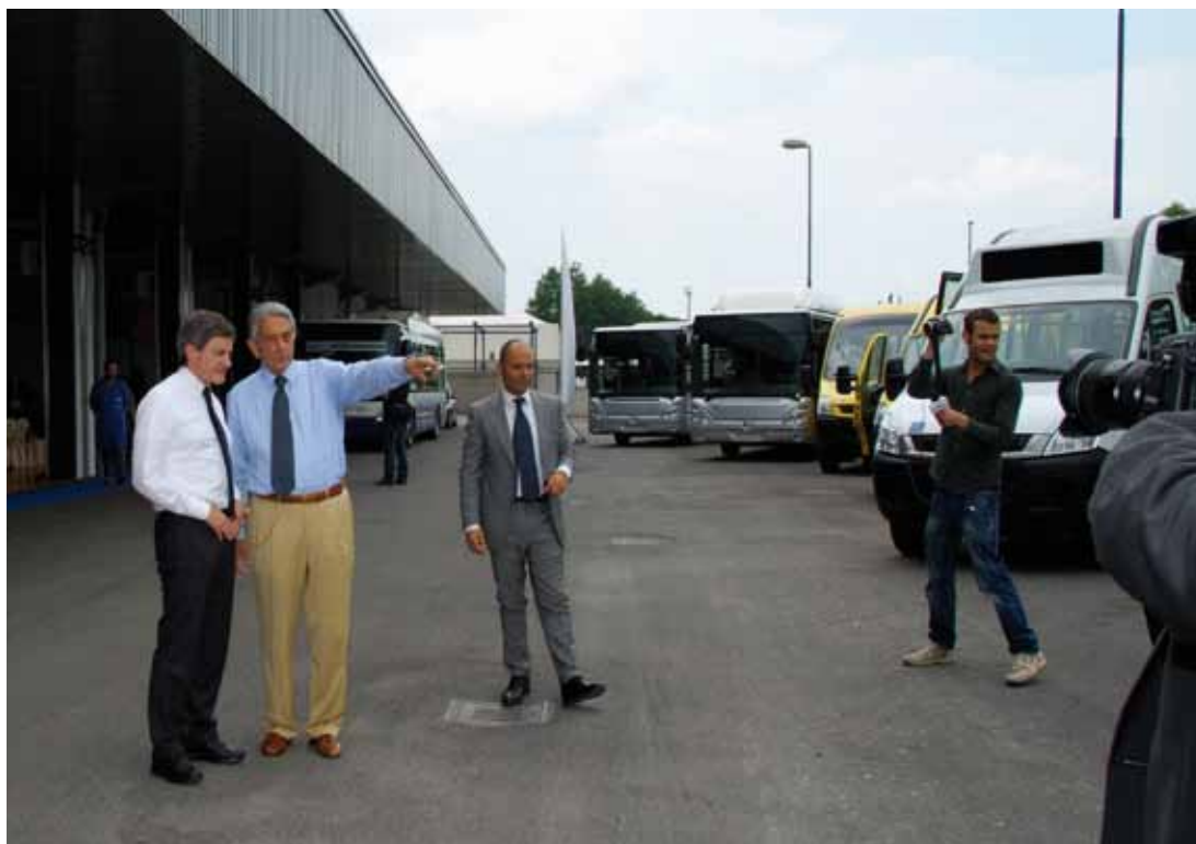
A sinistra il Sindaco prende visione di tutta la gamma Iveco Irisbus