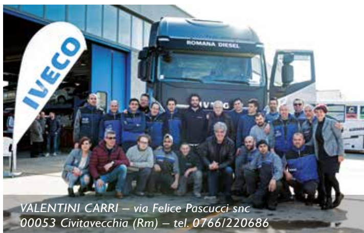
VALENTINI CARRI – via Felice Pascucci snc 00053 Civitavecchia (Rm) – tel. 0766/220686

Numerosi i Clienti accorsi per conoscere più da vicino i nuovi mezzi e provarli su strada con il "test drive". Come sempre in queste occasioni buffet e gadget distribuiti a grandi e piccoli. L'iniziativa che è servita anche a incrementare i rapporti già ottimi con le nostre Officine Autorizzate, proseguirà coinvolgendo tutta la nostra rete.