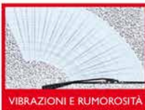
VIBRAZIONI E RUMOROSITÀ