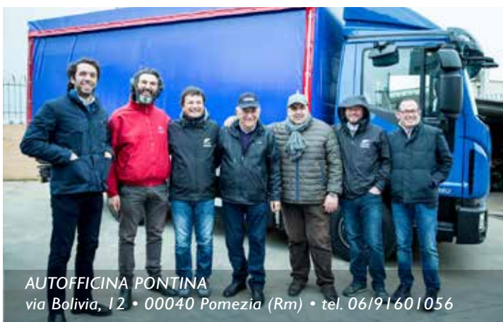
AUTOFFICINA PONTINA via Bolivia, 12 • 00040 Pomezia (Rm) • tel. 06/91601056

00065 Fiano Romano (Rm) • tel. 0765/514218