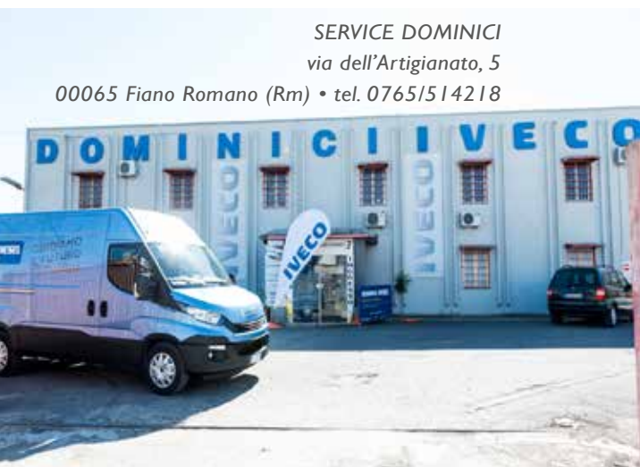
SERVICE DOMINICI via dell'Artigianato, 5

00065 Fiano Romano (Rm) • tel. 0765/514218