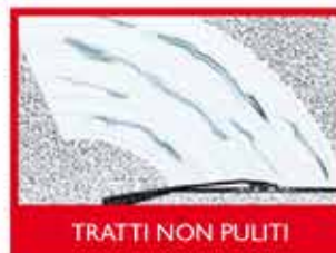
TRATTI NON PULITI

RECATI SUBITO DAL TUO CONCESSIONARIO IVECO!