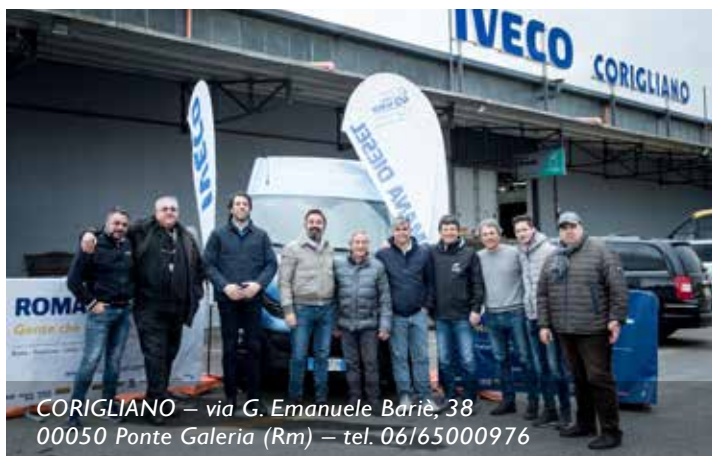
CORIGLIANO – via G. Emanuele Bariè, 38 00050 Ponte Galeria (Rm) – tel. 06/65000976